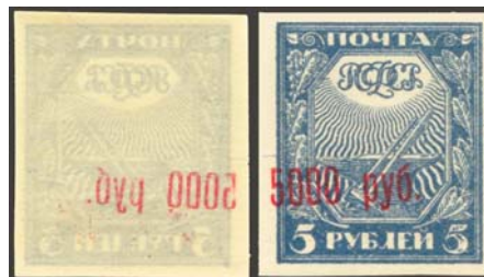
Рис. 17: м. № 21.