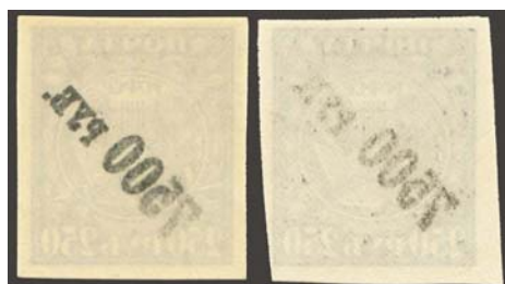
Рис. 22: м. № 24.