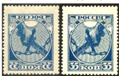
Рис. 1. Абкляч м. № 1.

Абкляч – это зеркальный отпечаток рисунка марки на ее клеевой стороне, полностью совпадающий по расположению с рисунком на лицевой стороне марки (рис. 1 и 3). Абклячем является также зеркальный отпечаток рисунка на клеевой стороне марки, незначительно сдвинутый в какую-либо из сторон (рис. 2 и 12), а также зеркальный отпечаток только части рисунка, но также совпадающий с рисунком на лицевой стороне.