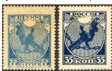
Рис. 2. Сдвиг вниз.