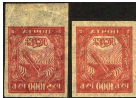
Рис. 15: м. № 13А

На значительной части марок с надпечатками нового номинала и текста □Р.С.Ф.С.Р.□, номиналов □7500 РУБ.□ и □100.000 РУБ.□, а также в помощь населению, пострадавшему от неурожая, □Р.С.Ф.С.Р. / ГОЛОДАЮЩИМ / новый номинал□ имеются абклячи надпечаток (рис. 16 – 26). На рис. 18 приведено изображение горизонтальной пары м. № 17А на тонкой бумаге с абклячем только на одной из марок.