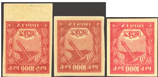
Рис. 14: м. № 13 на разных бумагах.