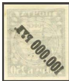
Рис. 25: м. № 49.