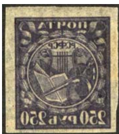
Рис. 11: м. № 10А.