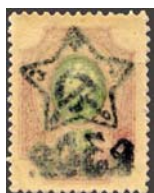
Рис. 36: № 63.

На значительной части почтовых марок РСФСР с надпечаткой пятиконечной звезды с серпом и молотом и новых номиналов на марках императорской России имеются абклячи надпечаток (рис. 36, 37). Указанные надпечатки делались на дореволюционных марках, имеющих также абклячи своих рисунков (рис. 38 – м. № 63 с абклячем центра м. № 76 Российской империи).