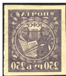
Рис. 10: м. № 10.