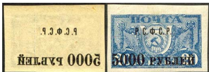
Рис. 16: м. № 17.

На значительной части марок с надпечатками нового номинала и текста □Р.С.Ф.С.Р.□, номиналов □7500 РУБ.□ и □100.000 РУБ.□, а также в помощь населению, пострадавшему от неурожая, □Р.С.Ф.С.Р. / ГОЛОДАЮЩИМ / новый номинал□ имеются абклячи надпечаток (рис. 16 – 26). На рис. 18 приведено изображение горизонтальной пары м. № 17А на тонкой бумаге с абклячем только на одной из марок.