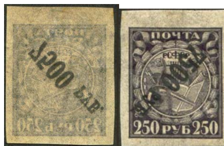
Рис. 23: м. № 24А, надпечатка перевернута.