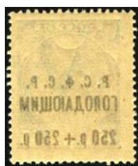
Рис. 24: м. № 35.