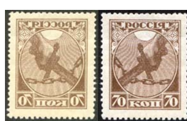
Рис. 3. Абкляч м. № 2.

Абклячи возникают вследствие пропуска листа бумаги при рабочем ходе печатной машины. При этом изображение марок с формного цилиндра или печатной формы переносится на печатный цилиндр (см. рис. 4), с которого при следующем ходе печатной машины это изображение переносится на обратную сторону листа (уже в зеркальном изображении) одновременно с печатью рисунка марок на лицевой стороне.