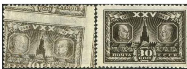
Рис. 42: м. № 850.