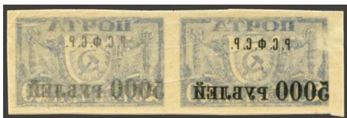
Рис. 18: м. № 17А.