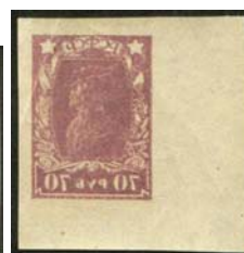
Рис. 35: № 75.