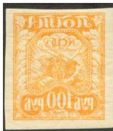
Рис. 7: м. № 8.

Во второй части первого стандартного выпуска абклячи появляются на марках всех номиналов, как на простой, так и на тонкой бумаге (рис. 7 – 13), за исключением м. № 11А 300 р. На марке номиналом 1000 р. абклячи имеются также на всех типах простых бумаг № 13 и 13А, использованных для печати этих марок (рис. 14 и 15), а также на мелованной № 13Б и хлопчатой № 13В.