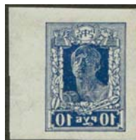
Рис. 34: № 73.