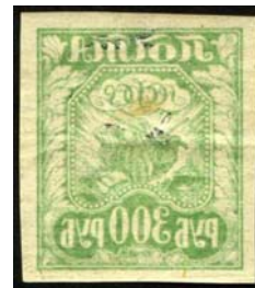
Рис. 13: м. № 11.