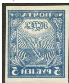
Рис. 5: м. № 5.

В первой части первого стандартного выпуска почтовых марок РСФСР абклячи имеются только на двух марках: № 5 и № 6 (рис. 5 и 6). На рис. 6 показана марка с двумя надпечатками значка, проставленного торгующей организацией и удостоверяющего подлинность марки и подлинность абкляча её рисунка.