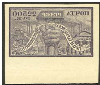
Рис. 30: № 38.

Известны абклячи на марках второго и третьего стандартных выпусков РСФСР, а также на двух из четырех марках второго почтово-благотворительного выпуска в помощь населению, пострадавшему от неурожая (рис. 30 – 35).