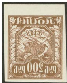
Рис. 9: м. № 9.