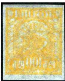
Рис. 8: м. №8А.