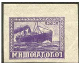
Рис. 33: № 52.