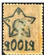
Рис. 37: № 65.