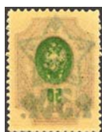
Рис. 38: № 63.