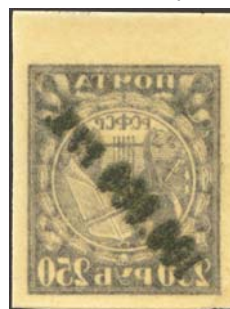
Рис. 26: м. № 49А.

Известны абклячи на марках, посвященных четвертой годовщине Великой Октябрьской социалистической революции, и на марках почтово-благотворительного выпуска в помощь населению Поволжья, пострадавшему от неурожая, за исключением марки № 31 зеленого цвета (рис. 27 – 29). На последних существуют абклячи рисунков марок как первого, так и второго типов (труба дома белая или закрашена).