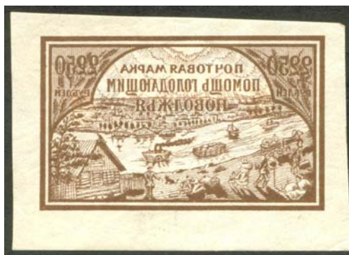
Рис. 29: № 30.