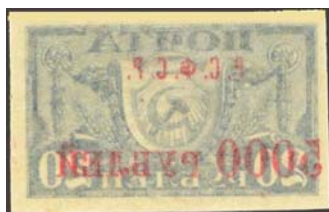
Рис. 20: м. № 22А.