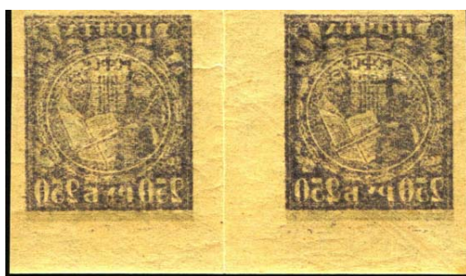
Рис. 12: м. № 10А, сдвиг вверх.