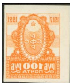
Рис. 27: № 25.

Известны абклячи на марках, посвященных четвертой годовщине Великой Октябрьской социалистической революции, и на марках почтово-благотворительного выпуска в помощь населению Поволжья, пострадавшему от неурожая, за исключением марки № 31 зеленого цвета (рис. 27 – 29). На последних существуют абклячи рисунков марок как первого, так и второго типов (труба дома белая или закрашена).