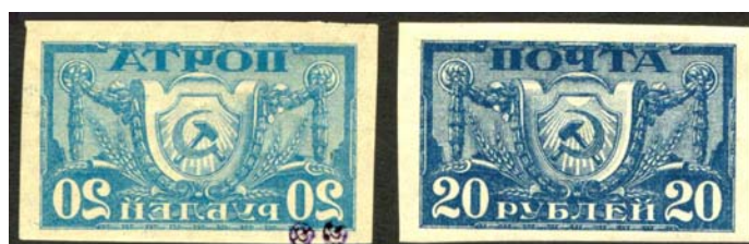
Рис. 6: м. № 6.