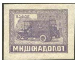
Рис. 32: № 50.