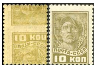
Рис. 41: м. № 320.

На рис. 39 и 40 приведены зеркальные изображения надпечаток: марки № 63 на клеевой стороне той же марки в первом случае (надпечатка перевернута) и марки № 66 на клеевой стороне м. № 54, посвященной пятой годовщине Великой Октябрьской социалистической революции, во втором случае. Зеркальное изображение на клеевой стороне марок – это отпечаток рисунка марки в зеркальном виде, не совпадающий с изображением на лицевой стороне. Это может быть или часть рисунка, как на рис. 41 и 42, или даже отпечаток другой марки, как на рис. 43.