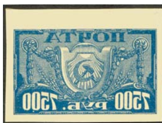
Рис. 31: № 40.