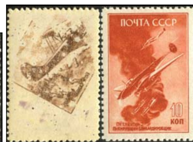
Рис. 43: зеркальное изображение части рисунка м. 1036 на клеевой стороне м. 1031.