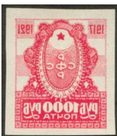
Рис. 28: № 27.