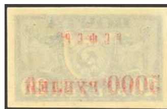
Рис. 19: м. № 22.